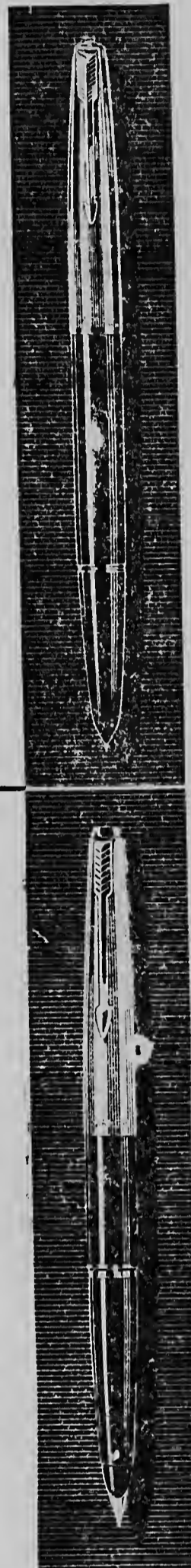
THE PARKER PEN COMPANY - PHOENIXVILLE, PENNSYLVANIA, U.S.A.